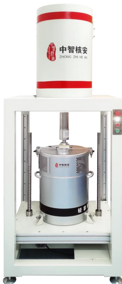
图 1 ACR-HPGe 反康普顿射线高纯锗 \gamma 谱仪

ACR-HPGe 反康普顿射线高纯锗 \gamma 谱仪由超低本底宽能高纯锗探测器、反康普顿环探测器、低本底铅室、反康塞探测器、反符合电子学模块、多道分析器、探测器组件自动升降平台、液氮回凝制冷机、能谱分析软件、无源效率刻度软件和基于三维激光扫描的无源效率刻度软件等组成，如图 1。主要用于降低低能段能谱的本底，降低低能段核素的探测下限。