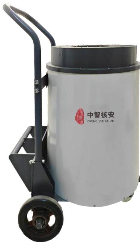
图 1 GammaArray-64 装置外观

GammaArray-64 型废物包 \gamma 放射性清洁解控测量装置由 NaI \gamma 能谱仪阵列（可选配溴化铯探测器）、屏蔽体、串口服务器、能谱分析软件等组成，如图 1。其中 NaI \gamma 能谱仪阵列由 64 个 2 英寸 NaI 探头以及每个探头配套的光电倍增管、数字化多道、高压模块等组成。GammaArray-64 基于精密化的数学物理模型，对于每一种核素，在每个探测器测量能谱解析的基础上，结合无源效率刻度技术，求解 64 个非线性代数方程组成的方程组，获得软废物包内放射性核素活度分布和总活度，并根据清洁解控标准，做出被测量对象是否解控的判断。使用中，用户只需要将废物包放入测量腔室，装置自动完成测量，自动出具测量结果的报告。